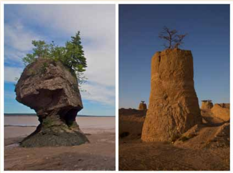
Hopewell rocks - Canada, the forces of nature. גבעות רודד - דרום הערבה, יד האדם והשופל. הפוך אבל דומה, דומים והפוכים.