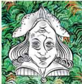
1. פִּאֲרָץ אַחַת, שְׂמֵה תַרְתִּי דִּסְתַבְרִי, הִיחַ טַעֲשָׁה לֹא כְנִיל לְנַמְרִי, אִיפְכָא הַקֶּלֶן, אִזּוּ יַחֲדוּ מְלֻכְתּוֹ.