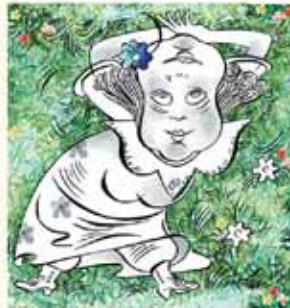
3. הִשְׁנָה שָׁם כִּכּוּ וְהַשְׁמִישׁ נְרִחָא, אִיפְכָא שְׂמֵחַ וּמַסְתַּבְרָא שְׂמֵחָא, כִּשְׁנָה הַמְלָקָה עַל הַדְּשָׂא הַרְדָּ.