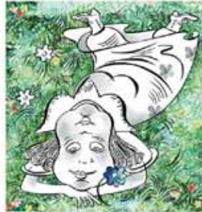
4. וְהַסְלֵן לְשֹׁבַע עַל בְּטֵנוּ כְּמוֹ פְרִיחָא.