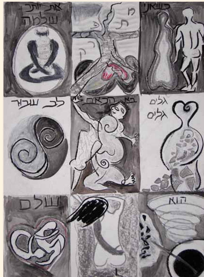
כשאני מתפרק את יותר שלמה. גלים גלים בא הכאב, לב שבור הוא לב שלם.