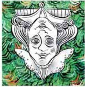
2. נָצָא לְטִיל עִם מַסְתַּבְרָא אִשְׁתָּא.