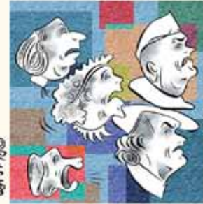
5. הַשְׂרִים הַסְתַּכְלוּ מְלֵאֵי תַדְהַקוּ