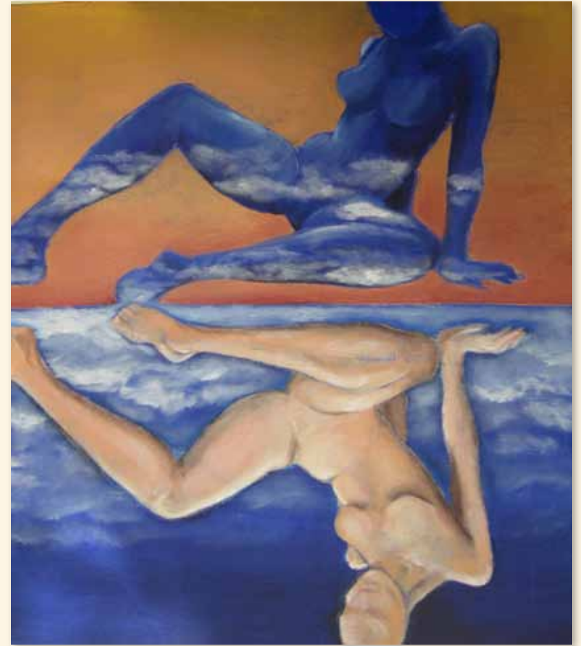
העזו להתבונן על דברים "באופן הפוך" ואתם עשויים לגלות דברים שמעולם לא ראיתם...