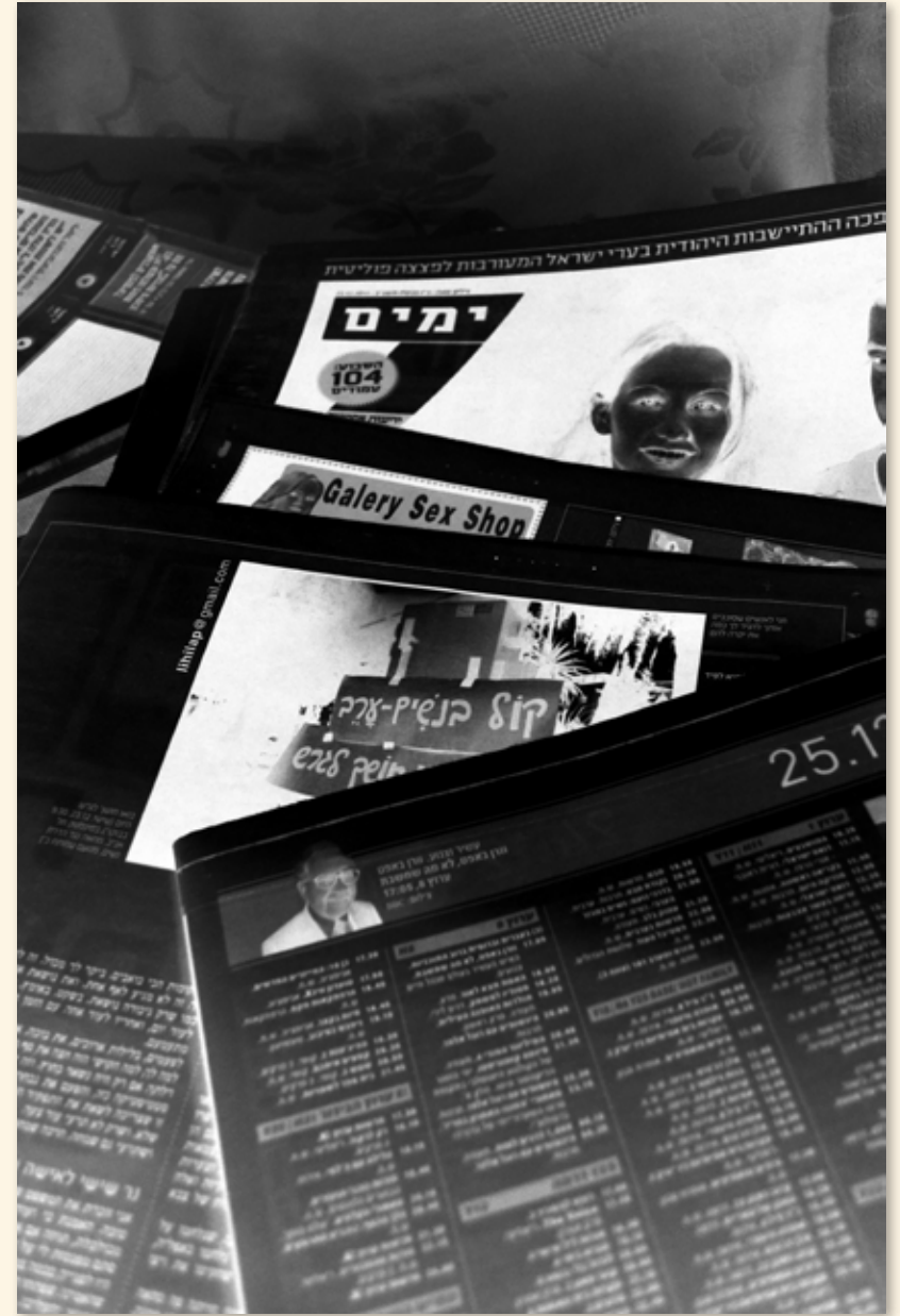
השתקפות אסתי אסא צילום 100 X 80 ס"מ