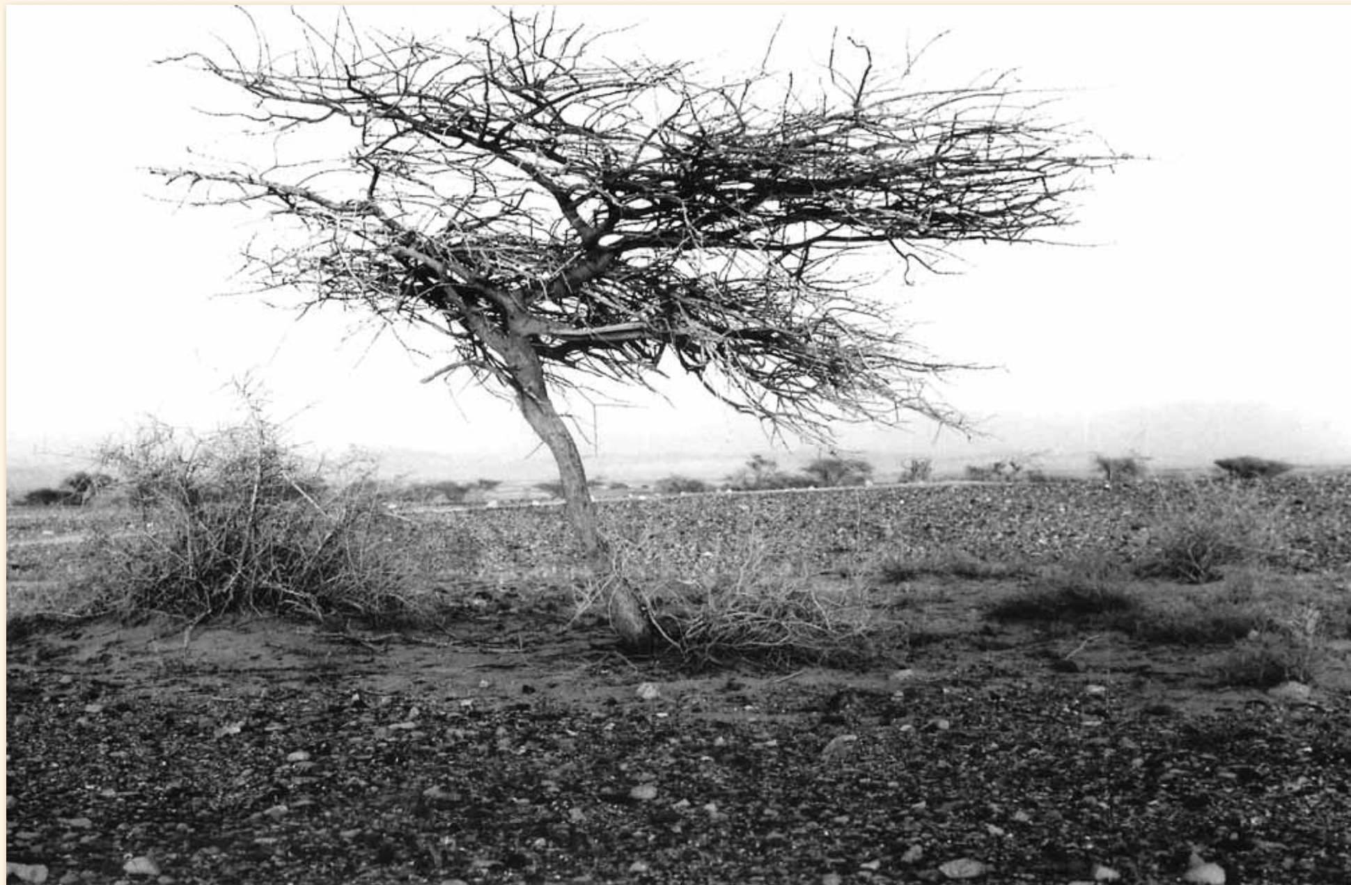
שיטה להתבודד בערבה.

המדבר לשיטתו שירי צפדיה ועמי רותם ברזל בניין וצילום דיגיטלי 180 ס"מ