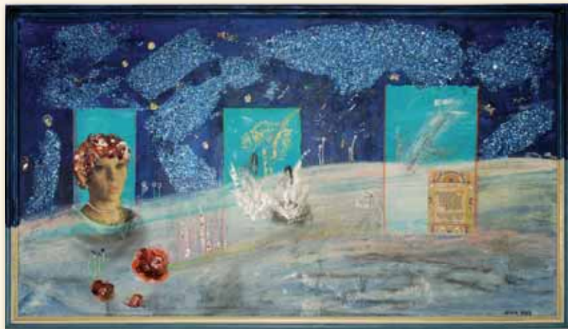
שלושה חלונות הנותנים הצצה למרחב של יופי ויצירה.