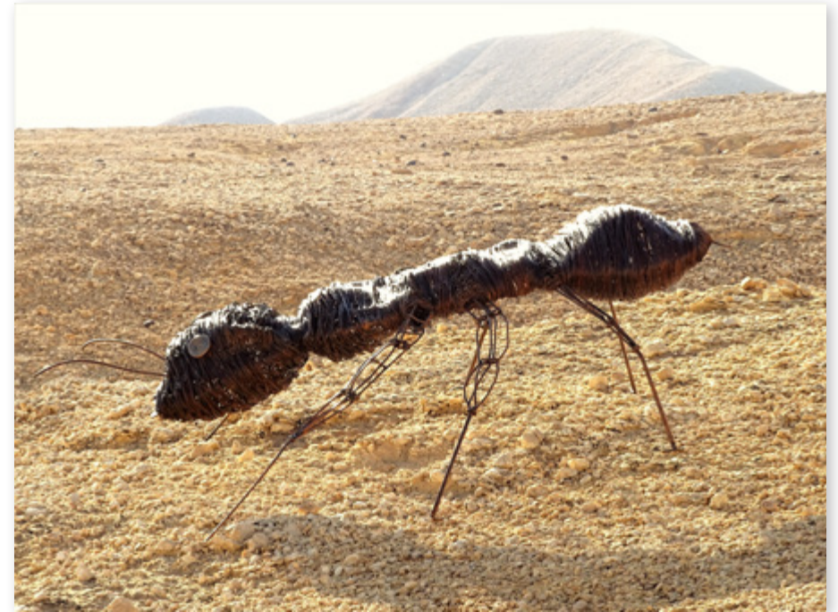
Andre Gunter Ant Metal and copper 190x110 cm

This work is an expression of a different perspective on the ant. By playing with proportions and size it gained presence and drama. Like everything else in life, it's a matter of your point of view.