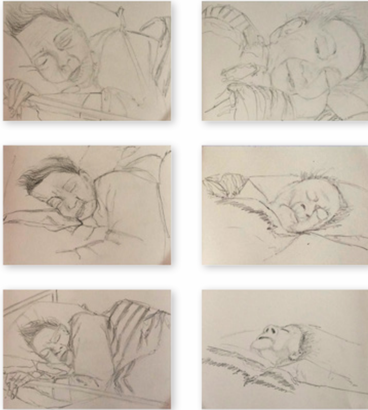
Shoshana Zlotnik Observation and Waiting Pencil on paper 65x60 cm

When I was a baby my mother looked at me and carefully watched every movement of my face, Today, as she lies on her deathbed, I watch every movement of her face.