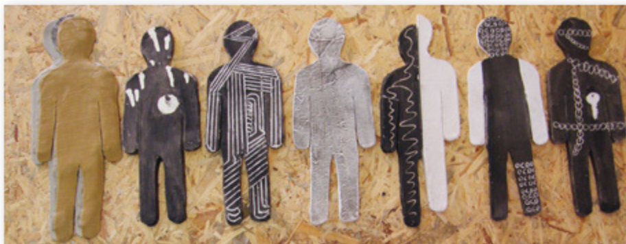
Zippy Dover The Depths of the Soul Clay 120x50 cm