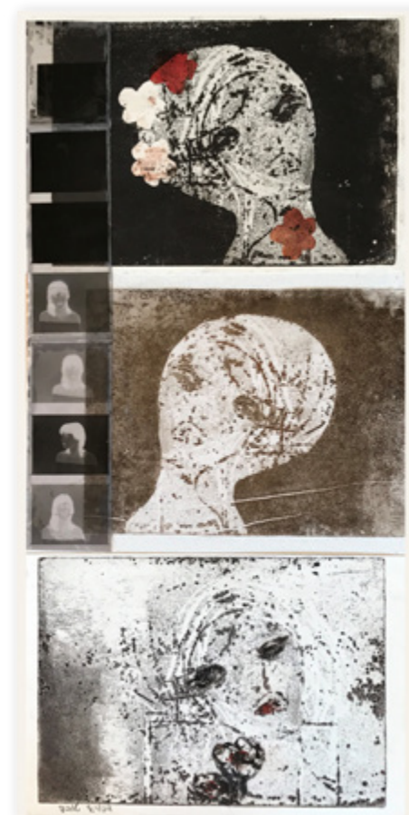
Tova Dvorai Point of View Etching collage 60x30 cm The point of view wanders and meanders from place to place for no ascertainable reason.