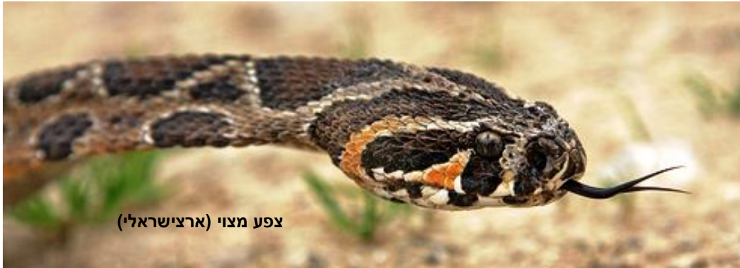
צפע מצוי (ארצישראלי)