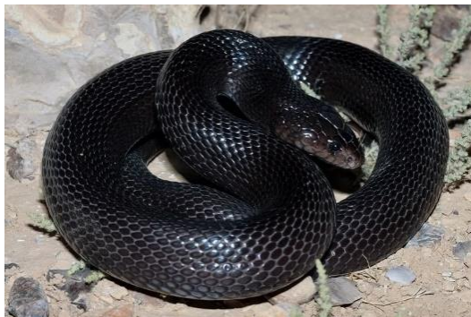
שרף עין גדי

בערבה, ים המלח - כיכר סדום וצפונה לבקעת הירדן ועד לגליל, במדבר יהודה - ממעלה אדומים ומזרחה וכן בלב הנגב.