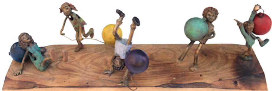
In Grandma and Grandpa's Backyard Naomi Rotem