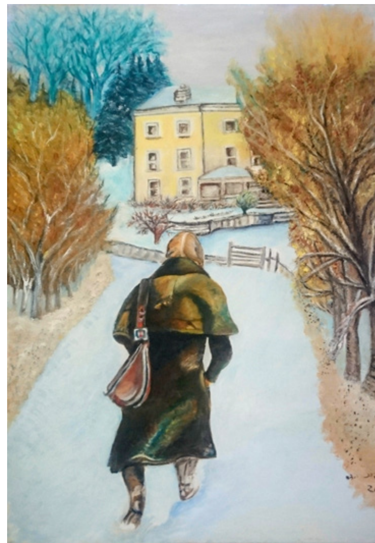
Back to Grandma's House