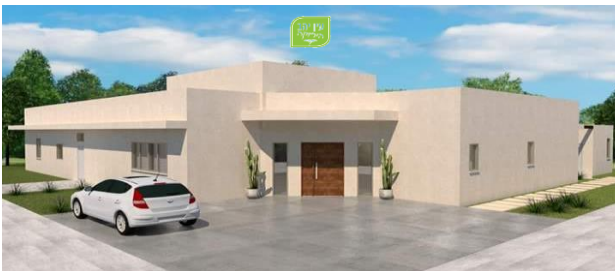
תכנון בית חדש בהרחבה עין יהב הירוקה

פרוייקט ההרחבה בעין יהב יכול להיות החלום שמתגשם עבורכם.